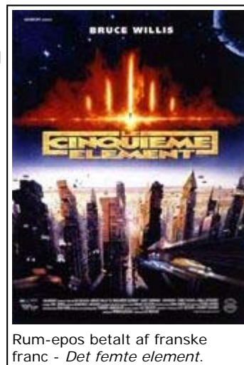
Rum-epos betalt af franske franc - Det femte element .

Fransk film har altid været meget åben for inspiration fra USA, nybølgen opstod i store træk ud af en række kritikeres koncentrerede møde med 6 års udvikling i amerikansk genrefilm efter 2. verdenskrig, og derfor var der ikke noget underligt i, at den i stadig stigende grad pengestærke franske filmindustri også havde ambitioner om at skele til drømmefabrikken "over there" for at se, om man ikke kunne liste et par gode fiduser ind i den nationale produktion. Luc Besson tog selv til USA og lavede Leon i 1994 og Det femte element i 1997, men især sidstnævnte havde så mange franske franc med i foret fra det store produktionselskab Gaumont, at man sagtens kunne hyldes i lidt national stolthed - for Det femte element blev et af de mest højrøstede eksempler på, at fransk film ville og kunne måle sig med de store.