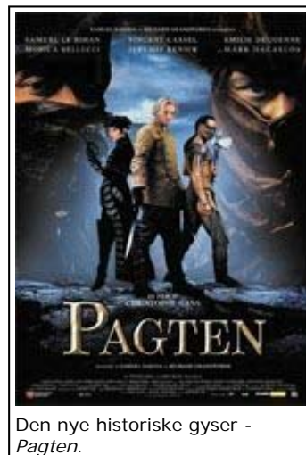
Den nye historiske gyser - Pagten .

Sidste år så vi i Danmark Christophe Gans' storslåede Pagten , som på mange måder er en udløber af den trend, som Besson skød i gang med Jeanne D'Arc . Den historiske storfilm, som franskmændene alle dage har været gode til, iført hektiske actionklæder. For i stedet for vittig dialog og smukke billeder, har man nu banal dialog, smukke billeder og en lang række actionoptrin,