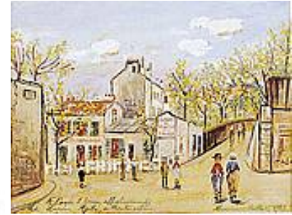
Le Lapin Agile Par Utrillo. Collection Privée