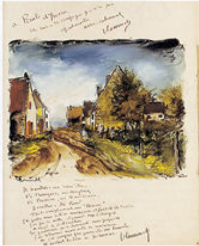
Extrait du livre de bord du Lapin Gouache de Maurice de Vlaminck