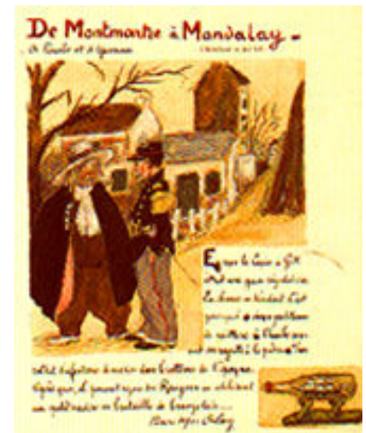
Livre de bord du Lapin Agile. Dessin et texte de Mac Orlan

- HISTORIQUE - INFOS - PLAN - E-MAIL - INTRO - SUITE -